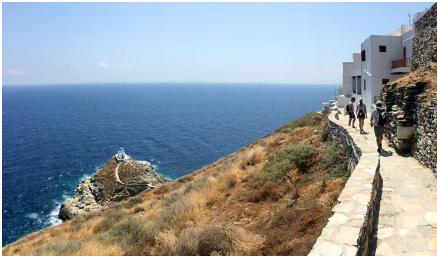
Randonnée sur l'île de Sifnos et la chapelle Efta Martyres

8 jours • 7 nuits • Rien à porter • Niveau : 2/5