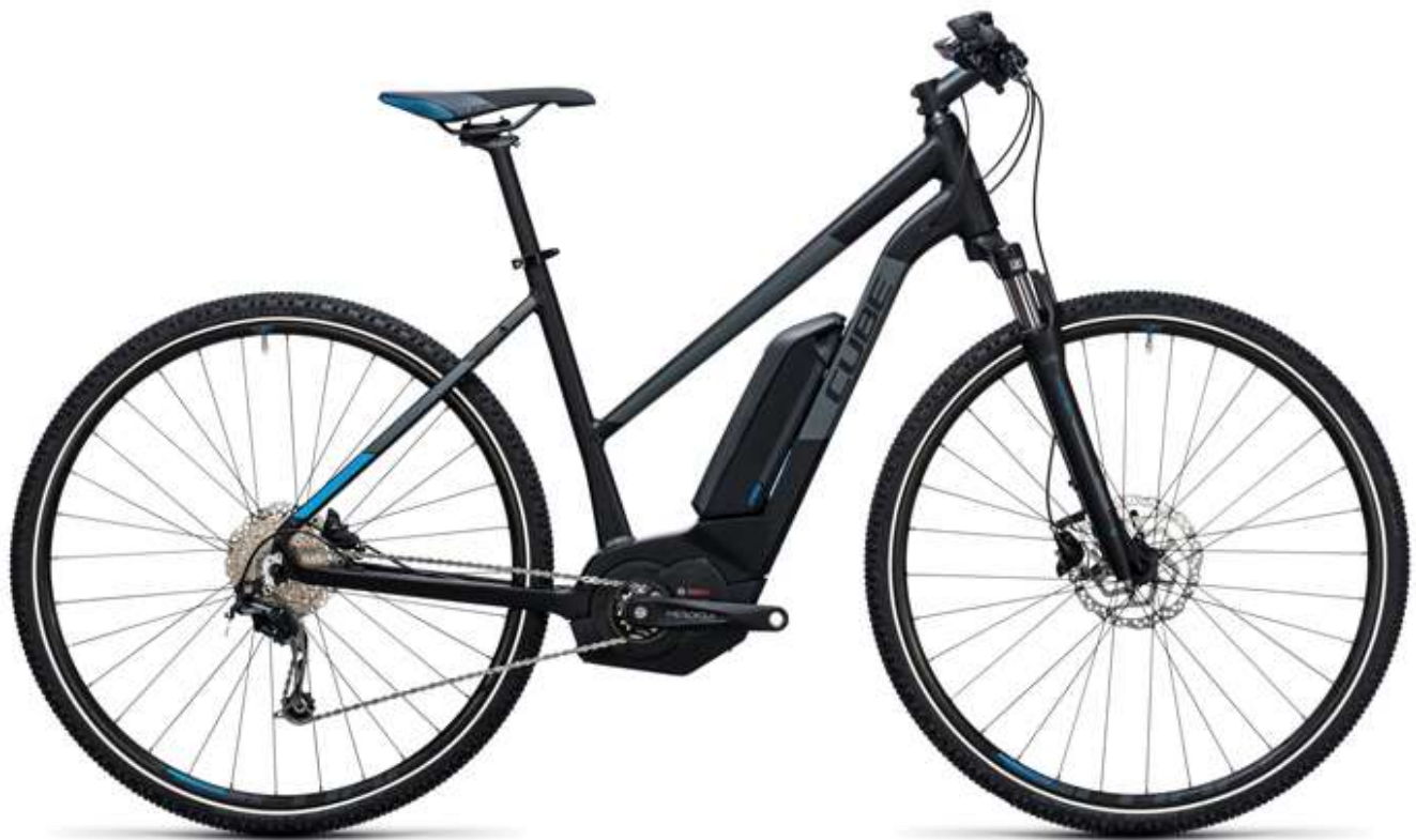
Cube Cross Hybrid Pro Allroad 500

Ce vélo se caractérise par son poids léger (20kg sans batterie) et adapté au tout terrain. Il est équipé d'un moteur très performant. La durée de la batterie est de 500 Wh. Il possède 9 vitesses. Jusqu'à 1m79 nous proposons un vélo modèle femme, au-delà d'1m80 nous fournissons un vélo modèle homme.